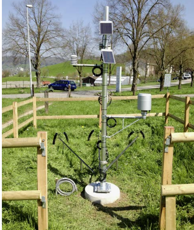
Eine Bodenmonitoringstation wie hier auf Liebegg in Gränichen AG erfasst Niederschlag auf 1,5 m Höhe, Lufttemperatur in 2 m Höhe, Luftfeuchte in 2 m Höhe, Saugspannung in 20 und 35 cm Tiefe sowie Bodentemperatur in 20 und 35 cm Tiefe.